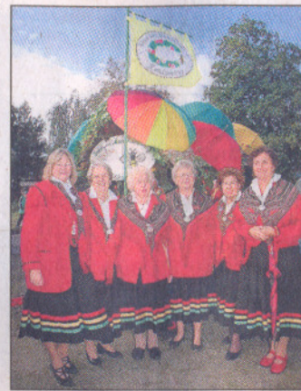
Mit Schirmen ausgestattet: der Wagen der Rundümwieser.