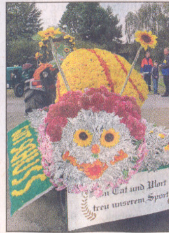
Steht für Gemütlichkeit: Blumenschnecke des SC Zentrum.