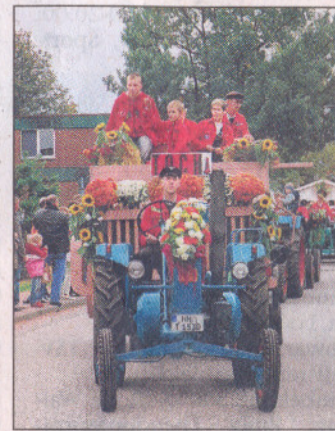
Hoch zu Wagen: Mitglieder des TOCH-Traktoren-Vereins.